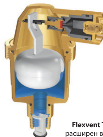
Flexvent TOP: расширен внизу и верхняя крышка в виде конуса.