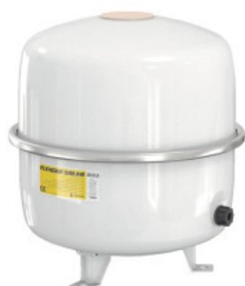
Flexcon Solar 35-80 л